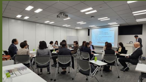
おもてなしフェスティバル2023の様子

昨年のフェスティバルにおける音声をお聴きいただくことで、今年2024年11月15日（金）開催予定「おもてなしフェスティバル2024」へのエントリー検討の機会にもなります。