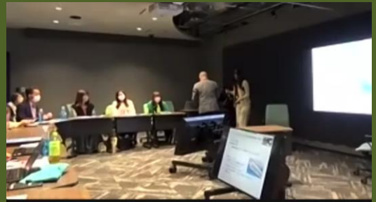
おもてなしフェスティバル2022の様子

昨年のおもてなしフェスティバルにおける音声を聴きいただくことで、今年2023年11月2日（木）開催予定「おもてなしフェスティバル2023」へのエントリー検討の機会にもなります。