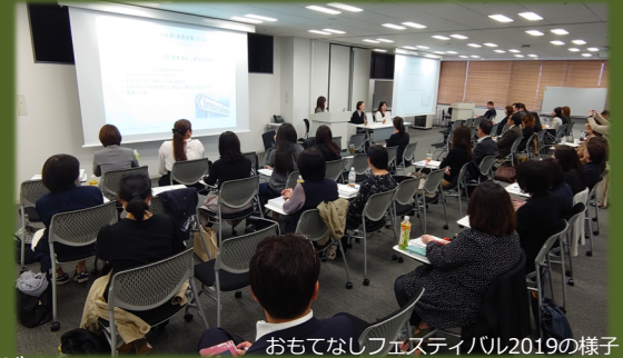
おもてなしフェスティバル2019の様子

オンライン参加者の意見や感想を共有しながら、なぜおもてなしに至ったのかを学ぶことができます。2020年11月6日開催「おもてなしフェスティバル2020」に関する情報もお伝えします。